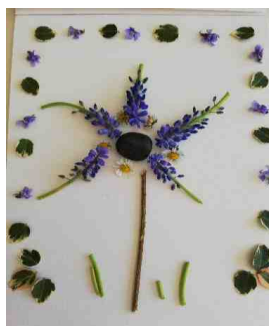
la composition de madame

cherche des collections d' éléments naturels dans le jardin ( ou à proximité de chez toi ) et réalise une belle composition ( un soleil, une fleur ou autre!)