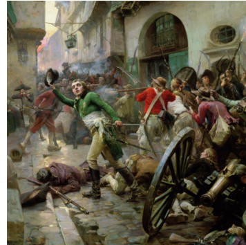
Paul - Emile Boutigny, la bataille de Cholet, 1899

Parce que la France révolutionnaire a exécuté Louis XVI, toutes les monarchies européennes sont désormais en guerre contre elle. De plus, la levée obligatoire de 300 000 hommes pour servir dans l'armée française provoque, en mars 1793 de violentes réactions dans l'Ouest de la France. En Vendée et dans d'autres régions, une armée de paysans royalistes et catholiques se lance dans une guerre contre les armées de la Révolution.