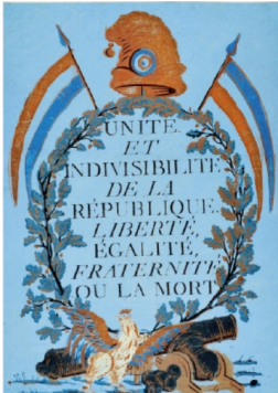
Estampe anonyme, fin du XVIII e siècle.

Après l'échec de la monarchie constitutionnelle, les révolutionnaires doivent inventer un nouveau régime, sans roi. Le 22 septembre 1792 ils instaurent la République, la première de l'histoire de France. La monarchie est abolie.