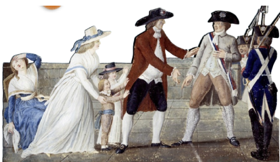
3 L'arrestation de Louis XVI à Varennes

D'après un article de la revue Histoire , n° 303, 2005.