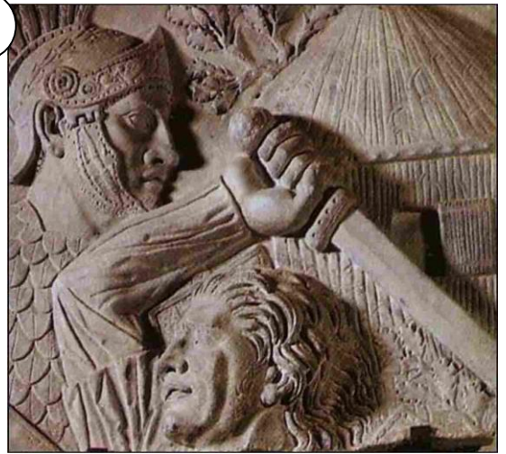
Gaulois combattant un légionnaire romain, Début du II ème s. av. J.-C. (Rome)