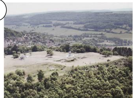
L'oppidum d'Alésia aujourd'hui