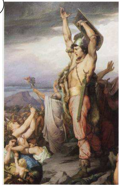
Vercingétorix appelle les Gaulois à la défense d'Alésia, F. Ehrmann, XIX ème siècle.