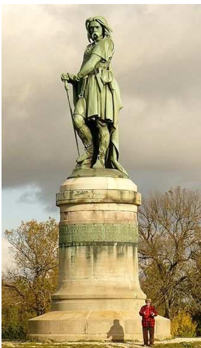
Statue de Vercingétorix (site d'Alésia, mont Auxois)