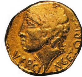
Monnaie gauloise en or, 1 er siècle av. J.-C.